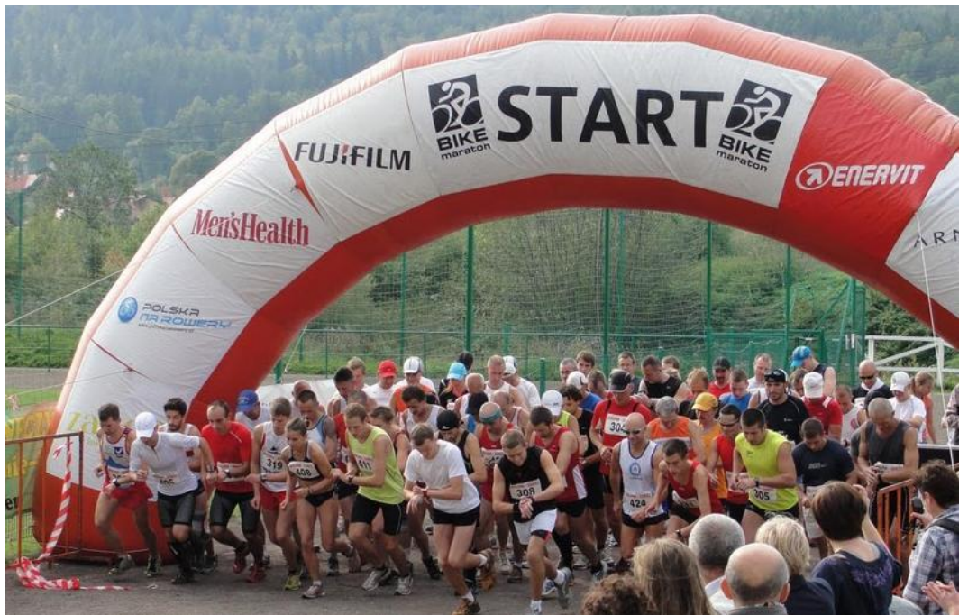
START II Półmaratonu „Czarodziejska Góra.”