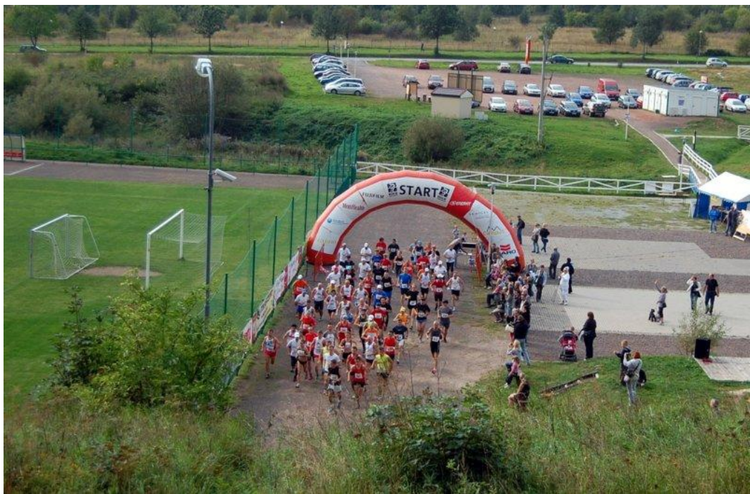
Start i zarazem meta usytuowana na terenie kompleksu Sportowo-Rekreacyjnego w Jedlinie-Zdroju.

Trasa biegu bardzo atrakcyjna i urozmaicona, a zarazem wymagająca.