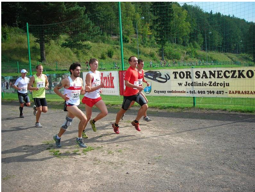
Czołówka biegu na pierwszej pętli.