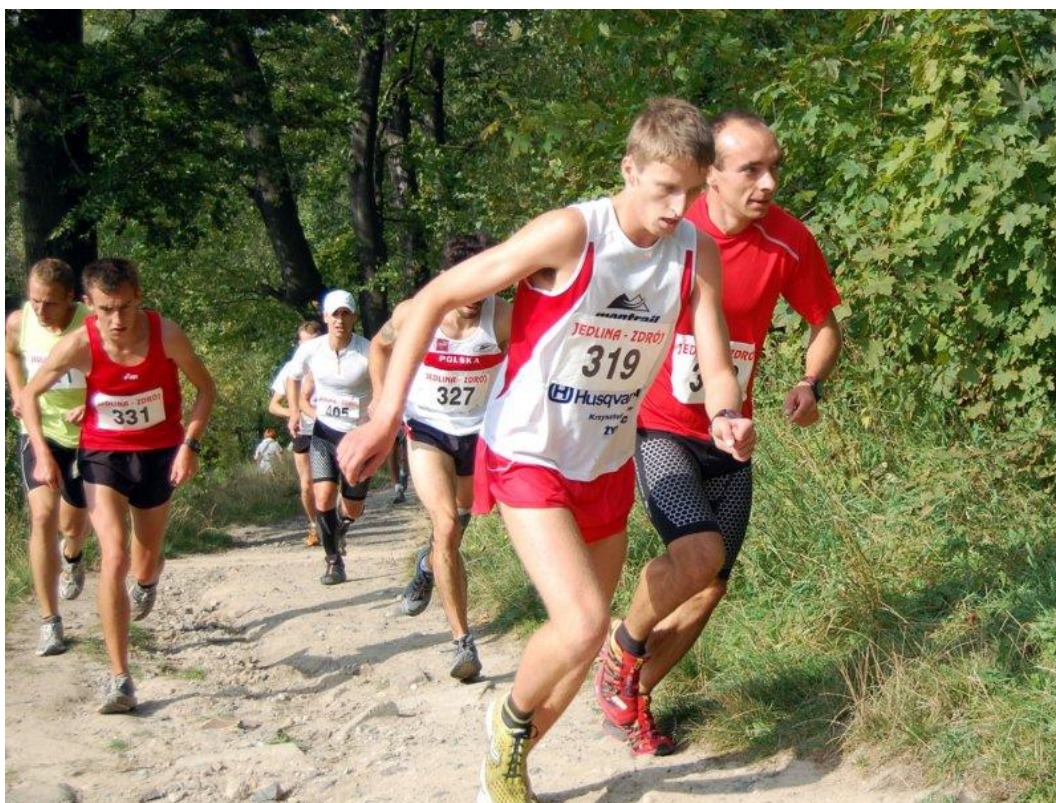
Sytuacja wśród zawodników czołówki na pierwszym podbiegu

Dopiero po pokonaniu Dłużycy (590m) i Kamiennej (631m) oraz przekroczeniu granicy ok. 5 km, trasa pozwalała na chwilę oddechu aż do Parku Linowego. Stąd jeszcze „tylko” dwa podejścia i ostatnie ok. 1,5 km karkołomnego zbiegu, plus płaski odcinek do mety.